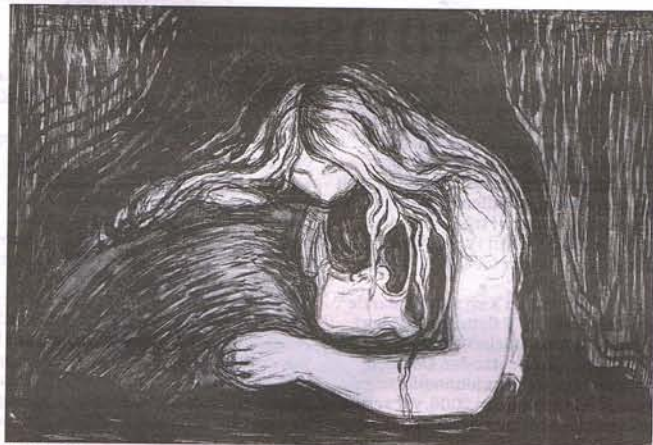
Edvard Munch Vampyr II , Woll 41. Selges på Munch-Auksjonen 2009, 30. november.